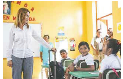
Inspección. Ministra Martens supervisó estado de las escuelas.

"Estamos en el momento propicio para controlar el dengue. Definitivamente, estamos preparados; hemos realizado una ardua tarea de fumigación y erradicación de criaderos de larvas del zancudo (transmisor)", indicó.